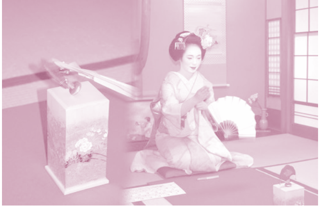
การแข่งขันพัด