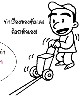
ทำเรื่องของตัวเอง ด้วยตัวเอง!

ใช้พรมเช็ดเท้าที่เขาใช้มีขนาดหลากหลาย เช่น ขนาดใหญ่ เล็ก ตรงทางเข้า และทางออกที่สถานปฏิบัติงานแต่ละแห่ง ขยายเวลาการเปลี่ยนพรมเช็ดเท้าของโรงงานเองให้ยาวขึ้น จาก 2 ครั้ง ต่อเดือน เป็น 1 ครั้ง ต่อเดือน เลิกใช้พรมที่ไม่ใช่ของ โรงงาน