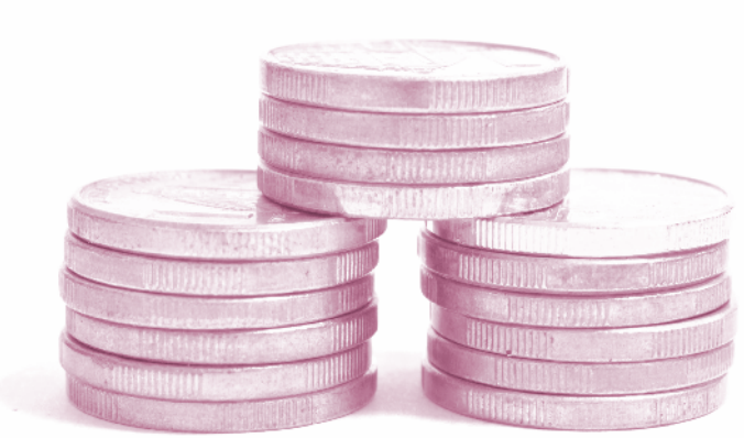
จำกัดของพม่า

อย่างไรก็ตาม ในส่วนของการแลกเปลี่ยนเงินตราต่างประเทศนั้น ในขณะนี้ได้มีการขอความร่วมมือในธนาคารพาณิชย์ ใ้ลดราคาซื้อขายเงินโดยตรงระหว่างสกุลท้องถิ่นให้ชัดเจนขึ้น เช่น สกุลเงินบาทกับสกุลเงินริงกิต ของมาเลเซีย หรือล่าสุด สกุลเงินบาทกับสกุลเงิน