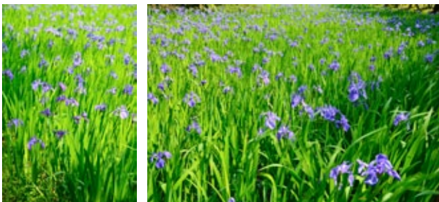
▲ คะคิชิบะตะ ที่ศาลโอะตะในเกียวโต เป็นไอริสป่าเก่าแก่ตั้งแต่ สมัยเฮอัน ได้รับการขึ้นทะเบียนเป็นพืชอนุรักษ์ของญี่ปุ่น

ทั่วประเทศญี่ปุ่น มีแหล่งชมดอกฮานะโชบุอยู่ราว 200 แห่งด้วยกัน การจัดวางตำแหน่งดูจะเป็นสิ่งสำคัญที่ทุกแห่งเน้น บางแห่งก็ปลูกให้สีต่างๆ ปะปนกัน โดยไม่ให้ก้ำกั้ว มีสีซ้ำกันในสวนอันกว้างใหญ่ บางแห่งก็แยกเป็นแถวๆ ตามสีตามพันธุ์ไป แต่ก็ให้ความสำคัญเรื่องสี โดยพยายามเอาสีม่วงเข้มมาปะปนไว้ในจุดต่างๆ โดยเฉพาะใกล้กับต้น สีชมพูหรือสีม่วง สีฟ้าอ่อน เพราะหากเอาสีอ่อนๆ ไว้เดี่ยวๆ เมื่อมองมา