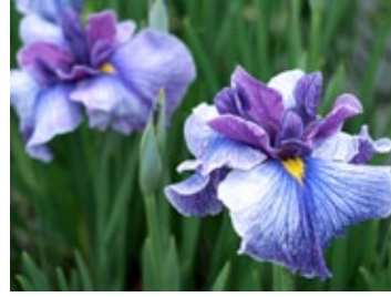
▲ ฮานะโชบุแบบอิโงะ