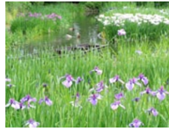
◀ สวน Shirokita Hana Sobu-en ที่ใจกลางเมือง โอซากา

จากไกลๆ จะดูจืดชืดไป บางแห่งก็จัดวางเป็นกอๆ ตามลำธารแคบๆ เสมือนในป่าเขา และบางแห่งก็มีการวางเรือลำเล็กๆ โดยมีการปล่อย ผุงเปิดว้ายไปมา มีศาลา และทางเดินเข้าไปนั่งหรือเดินชมได้ถึงกลาง สวน เป็นต้น