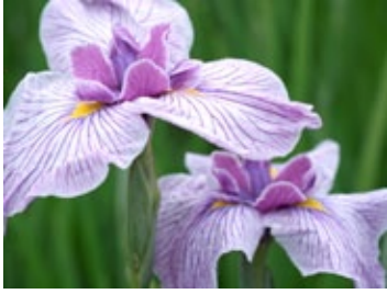
▲ ฮานะโชบุแบบ เอะโด