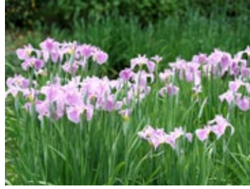
▲ ฮานะโชบุแบบ อิเสะ