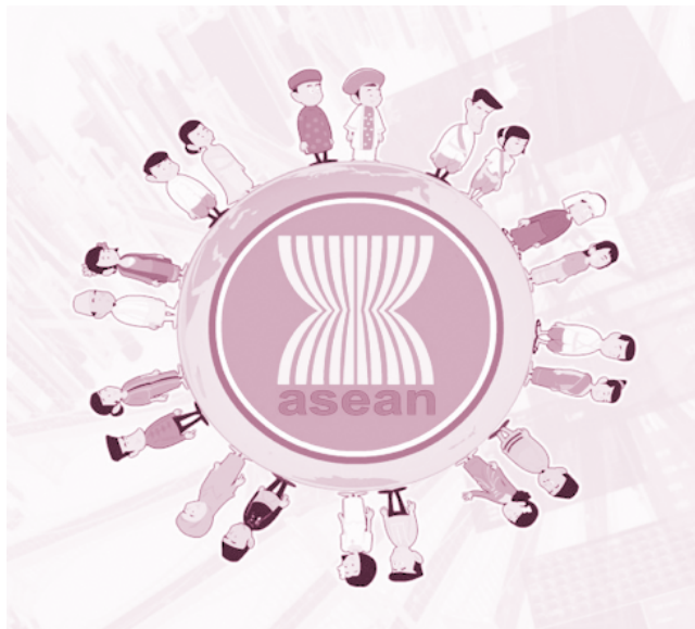
ภาพจาก https://www.google.co.th/search?q=ประชาคมอาเซียน+3+เสาหลัก&tbm

ที่มาก่อนจะมาเป็นประชาคมอาเซียน เกิดจากการที่ภูมิภาคเอเชียตะวันออกเฉียงใต้มีความขัดแย้งทางด้านอุดมการณ์ระหว่างประเทศ โดยเฉพาะเสรีนิยมประชาธิปไตยกับประเทศที่ยึดมั่นในอุดมการณ์สังคมนิยมคอมมิวนิสต์ขึ้น และความขัดแย้งด้านดินแดนระหว่างประเทศ ยกตัวอย่าง ความขัดแย้งกลุ่มมลายา และประเทศฟิลิปปินส์ในการอ้างกรรมสิทธิ์เหนือพื้นที่ซาบฮาร์ และซาราวัก ในช่วงเวลานั้นเองที่ประเทศสิงคโปร์ได้แยกตัวออกมาจากมลายา ทำให้หลายๆ ประเทศมองเห็นความจำเป็นในการที่จะจับมือกันในส่วนภูมิภาคนี้ ซึ่งก่อให้เกิดกระแสภูมิภาคนิยมในเอเชียขึ้น