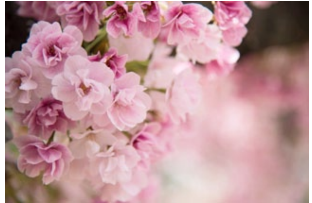
8. ซาซะเบะ-ซากุระที่โรงศพโอบิซากากา ดอกจะแน่นเบียดกันจนแทบมองไม่เห็นกิ่ง

1) Yoshino-yama เทือกเขาดันกำเนิดซากุระป่าในจังหวัดนาร่า ในอดีต ฮิเดะโยชิเจ้าเมืองโอซากาก็ค่อยยกกระบวณไปชม ทุกๆ เดือนเมษายนเมื่อซากุระเริ่มบาน จะมีผู้คนหลังไหลมาชมกันมากมาย โดยซากุระที่นี่จะเริ่มบานจากตีนเขา กลางเขา ไปจนถึงบนเขาตามลำดับ ทำให้ช่วงเดือนเมษายนสามารถชมได้ทั้งปี เดินทางโดย Kintetsu Yo-