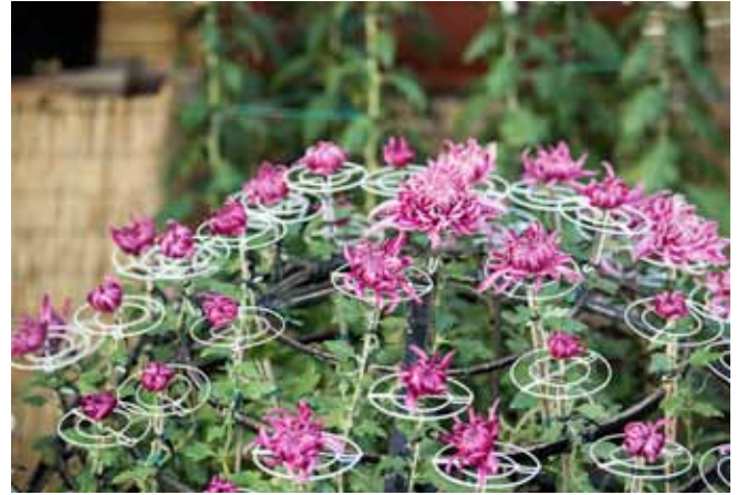
▲ การจัดแบบ Senrin-zaki

3) เคล็ดลับสุดท้ายในการชมคือให้นึกถึง “มงคลพรให้มีอายุวัฒนะ” อันเป็นความเชื่อแต่โบราณกาลที่มาต่อดอกเบญจมาศ เย็นวานนี้ คุณอิซิดะ เจ้าของที่ดินวัย 70 เศษ ที่ยังคงทำนาผืนเล็กๆ ใกล้ๆ บ้านผู้เขียนทางตอนเหนือของโอซากายังคงง่วนอยู่ในเรือนกระจก ทอยย่นาเบญจมาศที่ตัดแล้ว เตรียมออกไปจัดแสดงตามทีต่างๆ เช่นทุกปี เขาบอกว่า “ทำมาแล้วกว่า 30 ปี อยากรจะหยุดหาเวลาไปเที่ยวเมืองนอกเมืองนาบ้าง ก็เป็นห่วงต้นเบญจมาศ ต้องหมั่นดูแลกันแทบทุกวัน” เขาพูดไปมือก็คอยเอาหลอดเล็กๆ ตามดอกตูมอย่างประณีตทีละดอกๆ โดยไม่ได้หันมามองหน้าผู้เขียนเลย ดูเหมือนว่าสิ่งหนึ่งที่จะขาดไม่ได้ในการเลี้ยงดูเบญจมาศให้งดงามคือความละเอียดถี่ถ้วน และเอาใจใส่อย่างจริงจัง อันเป็นนิสัยอย่างหนึ่งที่พบในคนญี่ปุ่นส่วนใหญ่