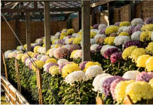
▲ แบบดอกใหญ่ที่มีสามดอกในต้นเดียว เป็นที่นิยมเลี้ยงแพร่หลาย