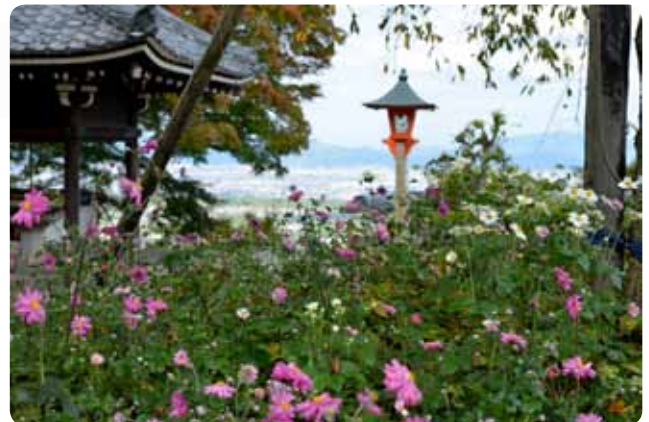
■ บานงดงามเป็นดั่งที่ลานบนเขาของวัด Yoshiminedera ในเกียวโต

โดยใช้อักษรจีนที่หมายถึง “คิคุ” (菊) หรือเบญจมาศกำกับไว้โดยเพิ่มคำว่า “ชู” (秋) หรือ “ฤดูใบไม้ร่วง” ลงไปด้วย เพราะมันจะบานรับฤดูใบไม้ร่วงทุกปี