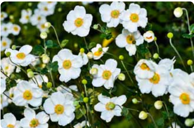
▲ เวลาบานเต็มที่พร้อมๆ กันแล้วจะงดงามมาก

นักพฤกษศาสตร์อธิบายว่าแท้จริงแล้วชูเมะอิจิคุไม่ใช่ดอกไม้สายพันธุ์เบญจมาศแต่อย่างใด เป็นดอกไม้ในตระกูล Ranunculaceae มีชื่อภาษาอังกฤษว่า Japanese anemone แพทย์ และนักพฤกษศาสตร์ชาวสวีเดนที่เดินทางมาญี่ปุ่นในศตวรรษที่ 18 เป็นผู้ตั้งชื่อไว้ อย่างไรก็ตาม พันธุ์สีขาวที่เห็นกันทั่วไปทุกวันนี้ไม่ใช่พันธุ์ดั้งเดิม