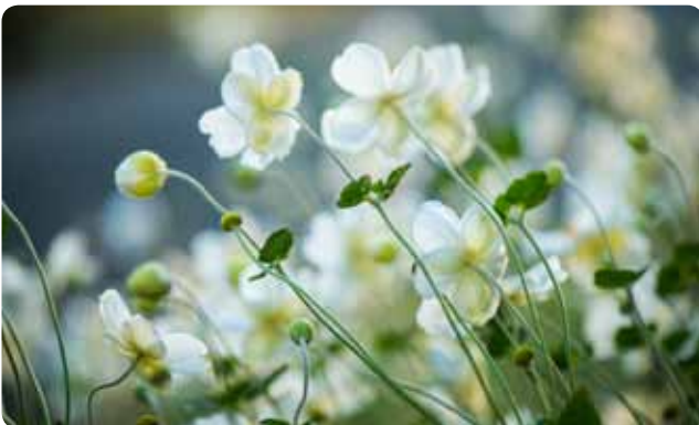
▲ ด้านหลังของดอกมองดูขาวสะอาด

ปัจจุบันนี้ ชูเมะอิจิคุได้รับการแปลงพันธุ์หลากหลายมากขึ้น บางพันธุ์มีกลีบซ้อนกันมากถึงกว่า 30 กลีบ สีสักคงอยู่ในเฉดสีขาว ชมพูอ่อน ชมพูแก่ และชมพูออกม่วง เป็นที่นิยมทั้งในหมู่ผู้รักการตกแต่งสวนทั้งตามบ้านเรือนทั่วไป และตามวัดวาอารามต่างๆ ตามเรือน้ำชาที่ต้องมีดอกไม้ประดับ (อิเคะบะนะ) แจกันประจำช่วงนี้