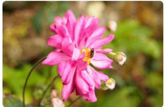
▲ คุฟูเนะอิงคพันธุ์ดั้งเดิมแบบกลีบซ้อนสีชมพูสด

“ชูเมะอิงค” (秋明菊) คือ ชื่อทั่วไปของเจ้าดอกไม้เล็กๆ มีเสน่ห์งดงามดังกล่าว ด้วยความที่ทั้งใบเขียวจัดเป็นหยักมีขนอ่อนๆ และเกสรของมันมีส่วนคล้ายเบญจมาศ (Kiku) มาก ผู้คนจึงตั้งชื่อมัน