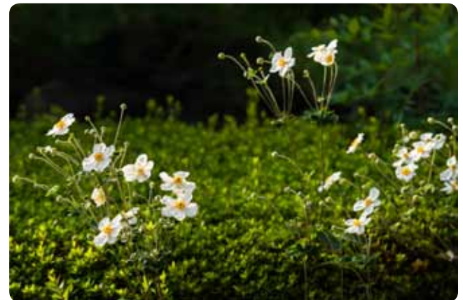
▲ เวลาแดดดามเย็นจะดูงามเป็นพิเศษ