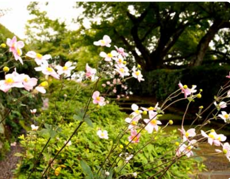
▲ ชูเมะอิงคสีชมพูที่เชิงเขาวัด Yoshiminedera ในเกียวโต

ใบไม้ ฤดูใบไม้ร่วงเริ่มเย็นลงราวปลายเดือนกันยายนไปจนถึงปลายตุลาคมหรือต้นพฤศจิกายน ดอกไม้สีขาวกลม ตัวต้นสูงราว 50-80 เซนติเมตร กลิบเดียว 5 กลีบ ขนาดราว 6 เซนติเมตร ก็เริ่มบานงดงาม ดอกไม้ดังกล่าวจะพบได้ทั่วไปตามวัดวาอารามหรือสวนพฤกษศาสตร์แทบทุกแห่งในญี่ปุ่น หน้าตาของมันดูจิ้มลิ้ม มีเกสรตัวเมียตรงกลางสีออกเขียวต่างๆ เหมือนรังผึ้ง ล้อมรอบไปด้วยเกสรตัวผู้สีเหลืองแน่นขนัด ใครเห็นเป็นครั้งแรกมักติดใจเดินย้อนกลับมาดูอีกครั้งหนึ่ง