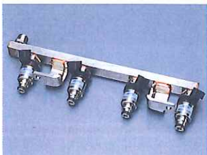
CNG/LPG fuel rail assembly for MPI (Mono-Fuel) CNG/LPG MPI 用フューエルレールアセンブリ(Mono-Fuel)