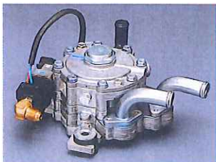
LPG Vaporizer LPG ベーパーライザ