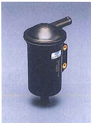
CNG/LPG fuel filter CNG/LPG 燃料フィルタ