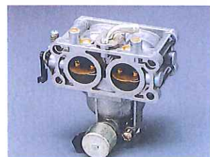
Carburetors for general purpose engines (two-barrel) 汎用気化器(2連タイプ)