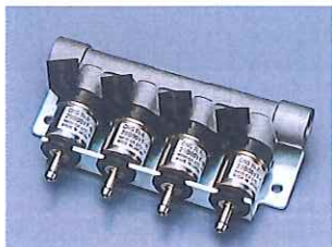
CNG/LPG fuel rail assembly for MPI (Bi-Fuel) CNG/LPG MPI 用フューエルレールアセンブリ(Bi-Fuel)

ガス燃料供給システムの部品として、燃料圧力調整装置（レギュレータ）、燃料供給装置（インジェクタ）、電子制御ユニット（ECU）などの主要部品の開発/設計/製造を行っています。また、制御ロジック開発、エンジン適合等の委託業務にも対応しています。