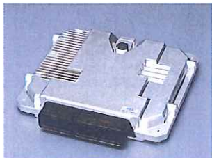
Electronic control unit for CNG engines CNGエンジン用電子制御ユニット