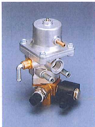
CNG regulator CNG レギュレータ