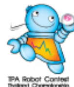
TPA Robot Contest Thailand Championship