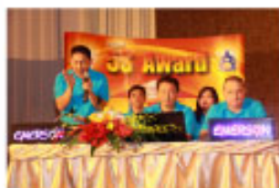
ノーンワー農家村