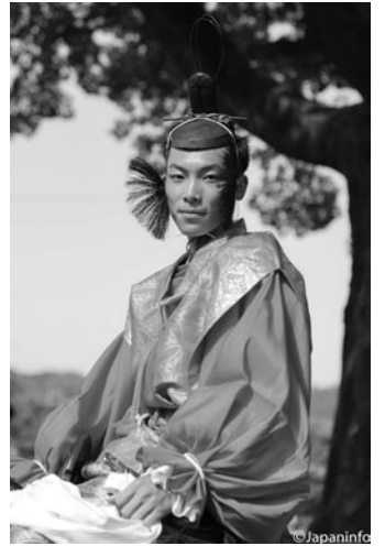
▲ หมู่มน้อยคนนี้เข้าร่วมขบวนในฐานะทหารม้ากับพี่ชาย มีคุณพ่อมาคอยตามถ่ายรูปกลางทาง