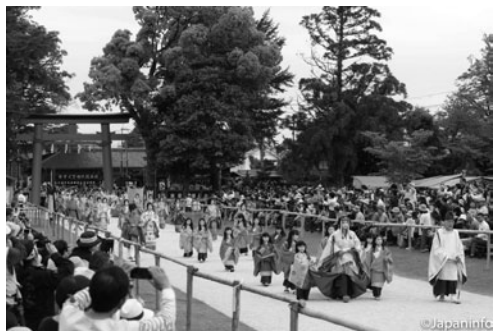
▲ ชบวนของไซโไคเดินเท้าเข้ามาในศาลคามิ-งาโมะ

ใบอาโออิพันบนกิ่งคัทสุราตัดไว้ที่หมวกบ้าง ที่หน้าอก และรอบๆ เกวียน ฯลฯ กันถ้วนหน้า บางตำราเชื่อกันว่าใบอาโออิเป็นสัญลักษณ์ของผู้หญิง กิ่งคัทสุราเป็นสัญลักษณ์ของผู้ชาย เมื่อนำสองสิ่งมาผูกกันจึงเสมือนการถือกำเนิดของเทพเจ้า และยังเป็นนิมิตที่ดีของความมั่งคั่งมีลูกหลานสืบทอดวงศ์ตระกูลต่อไป