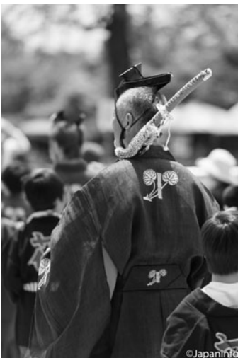
▲ ตราใบอาโออิคู (ฟูตาบะอาโออิ) ของศาลคามิ-งาโมะทั้งสองแห่ง