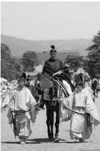
▲ ตัวแทนจักรพรรดิ (จกุกุชิ) บนหลังม้าที่สวนในพระราชวังเกียวโต

*ปัจจุบันนี้ นักท่องเที่ยวสามารถชมได้เฉพาะเทศกาลทางบกเท่านั้น โดยแยกชมได้ดังมาจากสามจุดด้วยกัน เริ่มตั้งแต่แถวหน้าประตูนครเมงในสวนของพระราชวังเกียวโต ถนนแคบๆ ที่ป่าทาดาสึโนะโมริหน้าศาลคามิ-งาโมะ และที่ถนนคาโมะโคโดไปจนถึงลานหน้าศาลคามิ-งาโมะ ทั้งบริเวณที่เป็นที่นั่งแบบชายบัตริ และบริเวณริมถนนที่เปิดให้ผู้คนไปยืนชมได้ฟรี บริเวณริมถนนคาโมะโคโดะช่วงราว 300 เมตรก่อนถึงสะพานมิโซโนะบาชิเป็นช่วงที่ถนนแคบมีต้นไม้ปกคลุมทั้งสองฝั่ง และมีเจ้าหน้าที่คอยกันไม่ให้นักท่องเที่ยวลงไปขวางขบวนแห่หรือเข้าไปอีกด้านหนึ่งของถนน ทำให้ร่มรื่น ชมได้ใกล้ชิด และถ่ายภาพขบวนแห่ได้งดงาม นักท่องเที่ยวสามารถไปตั้งคอกยได้ ระหว่างเวลา 14.55 - 15.30 น.