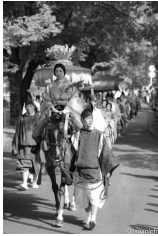
▲ นางในราชสำนักบนหลังม้า ส่วนใหญ่คัดจากหญิงสาวที่เติบโตในเกียวโตเช่นกัน

เป็นใบไม้รูปร่างคล้ายหัวใจมีดอกสีขาวเล็กๆ เลี้ยงติดพื้นดินที่มีแหล่งน้ำสะอาดไหลผ่าน ขึ้นตามธรรมชาติที่เขาโคยามะ และป่ารอบๆ ศาลคาโมะ ถือเป็นใบไม้ศักดิ์สิทธิ์ที่ช่วยปกป้องคุ้มครองผู้คนจากฟ้าผ่า และแผ่นดินไหว ยามตั้งชบวนแห่ไปสักการะเทพเจ้า ผู้คนในชบวนจึงประดับ