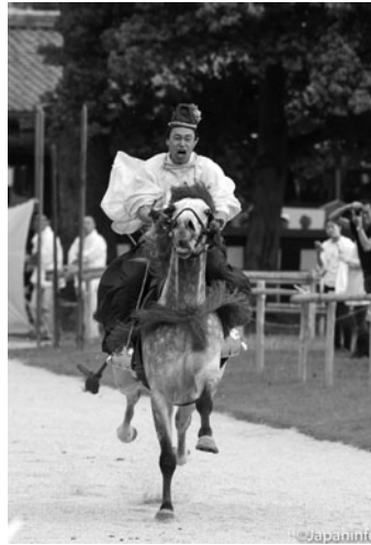
▲ การแข่งม้าเร็ว (คุราเบคุมะ) ปิดท้ายเทศกาลที่คามิ-งาโมะ

สิ่งหนึ่งที่น่าเรียนรู้คือนอกจากการจัดขบวนแห่ และเนื้อหาของพิธีกรรมจะดำเนินตามตำราดั้งเดิมแล้ว อาภรณ์ที่ผู้ร่วมขบวนสวมใส่ การแต่งหน้าทำผมของหญิงในราชสำนัก ยังอิงตำราเดิมทุกประการ มีผู้เชี่ยวชาญคอยกำกับดูแลทุกจุด หญิงสาวผู้ทำหน้าที่ตัวแทนเจ้าหญิง และผู้ร่วมขบวนแห่สำคัญๆ จะถูกขอให้สนับสนุนการเงินในด้านต่างๆ เช่น การตัดเย็บกิโมโนจุนิฮิโตะเอแบบสมัยเฮอัน มีการจัดทำร่มดอกไม้ เตรียมอุปกรณ์ ใหม่ทุกปี ทั้งนี้ นอกจะทำให้ขบวนแห่ดูอลังการแล้ว ยังเป็นการอนุรักษ์หัตถกรรมเก่าแก่ ของช่างฝีมือด้านต่างๆ ของเกียวโตอีกด้วย อาจกล่าวได้ว่าเทศกาลอาโออิ-มัทสึริในทุกวันนี้ จะไม่บังเกิดขึ้นเลย หากไม่ได้รับการร่วมแรงร่วมใจจากผู้คนในเกียวโตที่เห็นความสำคัญของธรรมเนียมประเพณีเก่าแก่ระดับชาติเช่นนี้