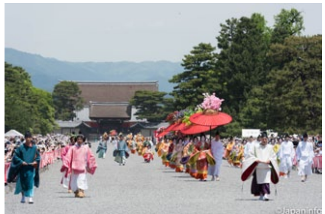
▲ ขบวนแห่ที่หน้าประตูเคนเรมงในพระราชวังเกียวโต

ต่อมาในปี ค.ศ. 819 เป็นต้นมาเทศกาลดังกล่าวได้ถูกกำหนดให้เป็นเทศกาลสำคัญระดับชาติที่ต้องมีตัวแทนจากราชสำนักไปร่วมด้วยทุกครั้ง โดยในเวลานั้นยังคงใช้ชื่อดั้งเดิมว่า "เทศกาลคาโมะ-มัทสุริ" อยู่