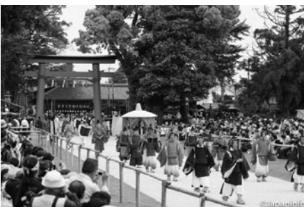
▲ เมื่อขบวนแห่เข้ามาในลานของศาลคามิ-งาโมะ ทุกคนจะลงจากหลังม้าหรือรถ

*ปัจจุบันนี้ นักท่องเที่ยวสามารถชมได้เฉพาะเทศกาลทางบกเท่านั้น โดยแยกชมได้ดังมาจากสามจุดด้วยกัน เริ่มตั้งแต่แถวหน้าประตูนครเมงในสวนของพระราชวังเกียวโต ถนนแคบๆ ที่ป่าทาดาสึโนะโมริหน้าศาลคามิ-งาโมะ และที่ถนนคาโมะโคโดไปจนถึงลานหน้าศาลคามิ-งาโมะ ทั้งบริเวณที่เป็นที่นั่งแบบชายบัตริ และบริเวณริมถนนที่เปิดให้ผู้คนไปยืนชมได้ฟรี บริเวณริมถนนคาโมะโคโดะช่วงราว 300 เมตรก่อนถึงสะพานมิโซโนะบาชิเป็นช่วงที่ถนนแคบมีต้นไม้ปกคลุมทั้งสองฝั่ง และมีเจ้าหน้าที่คอยกันไม่ให้นักท่องเที่ยวลงไปขวางขบวนแห่หรือเข้าไปอีกด้านหนึ่งของถนน ทำให้ร่มรื่น ชมได้ใกล้ชิด และถ่ายภาพขบวนแห่ได้งดงาม นักท่องเที่ยวสามารถไปตั้งคอกยได้ ระหว่างเวลา 14.55 - 15.30 น.