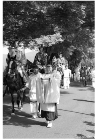
▲ ชบวนแห่ของโระริจิหรือทหารม้า แยกเป็นด้านขวา 3 คน ด้านซ้าย 3 คน