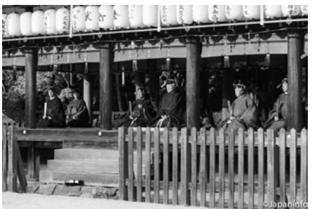
▲ ตัวแทนจักรพรรดิและพระของศาลหนึ่งชมการแข่งม้าที่ลานหน้าคามิ-งาโมะ