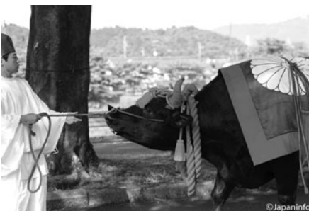
▲ นอกจากเกวียน 2 คันแล้ว ยังมีพระโคสำรองปิดท้ายขบวนมาด้วย