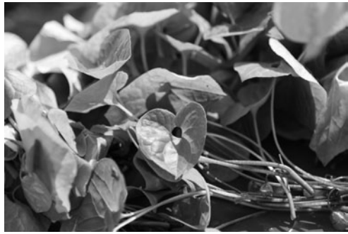
▲ ใบอาโออิที่ศาลฯ นำมาขายเป็นเครื่องรางในวันงาน