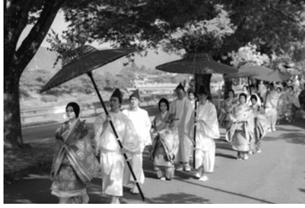
▲ ขบวนของเมียวฟูหรือนางในราชสำนัก