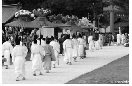
▲ รมดอกไม้ (ฟูริคาสะ) สีสังดาม

สิ่งหนึ่งที่น่าเรียนรู้คือนอกจากการจัดขบวนแห่ และเนื้อหาของพิธีกรรมจะดำเนินตามตำราดั้งเดิมแล้ว อาภรณ์ที่ผู้ร่วมขบวนสวมใส่ การแต่งหน้าทำผมของหญิงในราชสำนัก ยังอิงตำราเดิมทุกประการ มีผู้เชี่ยวชาญคอยกำกับดูแลทุกจุด หญิงสาวผู้ทำหน้าที่ตัวแทนเจ้าหญิง และผู้ร่วมขบวนแห่สำคัญๆ จะถูกขอให้สนับสนุนการเงินในด้านต่างๆ เช่น การตัดเย็บกิโมโนจุนิฮิโตะเอแบบสมัยเฮอัน มีการจัดทำร่มดอกไม้ เตรียมอุปกรณ์ ใหม่ทุกปี ทั้งนี้ นอกจะทำให้ขบวนแห่ดูอลังการแล้ว ยังเป็นการอนุรักษ์หัตถกรรมเก่าแก่ ของช่างฝีมือด้านต่างๆ ของเกียวโตอีกด้วย อาจกล่าวได้ว่าเทศกาลอาโออิ-มัทสึริในทุกวันนี้ จะไม่บังเกิดขึ้นเลย หากไม่ได้รับการร่วมแรงร่วมใจจากผู้คนในเกียวโตที่เห็นความสำคัญของธรรมเนียมประเพณีเก่าแก่ระดับชาติเช่นนี้