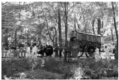
▲ เมื่อชบวนแห่ผ่านเข้ามาในถนนบริเวณป่าทาดาสุโระโมริในศาลคามิ-งาโมะ