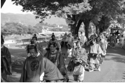
▲ ขบวนแห่เครื่องเซ่นสักการะเทพเจ้า