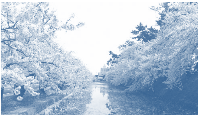
ความงามของซากุระในภูมิภาคโทโฮกุ

แต่มีความเชื่อในเรื่องที่มาของชื่อซากุระหนึ่ง ที่ผู้เขียนได้ยินบ่อย และไม่ได้ไปผูกกับตำนานเทพใดๆ คือ คำว่า ซากุระ มาจากการรวมคำระหว่าง Saku (咲<: さ<: Saku) ที่แปลว่า “(ดอกไม้) บาน” เป็นคำอกรวมกริยา และทำให้เป็นคำนาม โดยเติมคำว่า Ra (ら: Ra) ที่เป็นคำต่อท้ายเพื่อแสดงว่าเป็นพหูพจน์ในภาษาญี่ปุ่น รวมเป็น Sakura ที่น่าจะสื่อถึงดอกไม้ที่บานอย่างสะพรั่งมากมาย จนกลายเป็นชื่อต้นไม้ และดอกไม้ของต้นไม้ชนิดนี้ แต่ไม่ว่าซากุระ