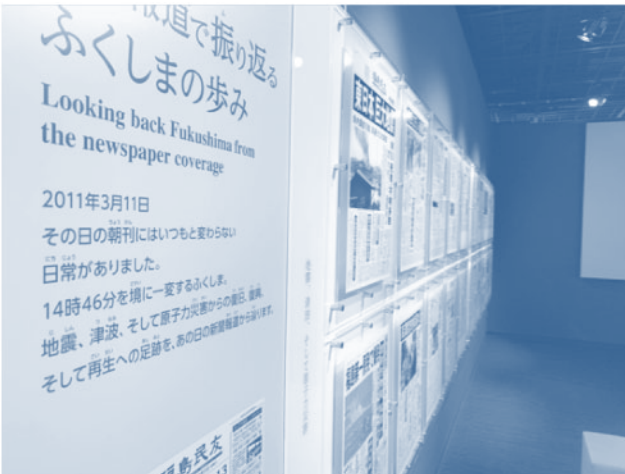
หน้าหนึ่งหนังสือพิมพ์ฉบับต่างๆ กับข่าวเหตุการณ์ภัยพิบัตินิวเคลียร์พุกุชิมะ

ภายในโซนแรกผู้เยี่ยมชมจะได้พบกับหน้าหนึ่งหนังสือพิมพ์กับข่าวเหตุการณ์ภัยพิบัตินิวเคลียร์ที่เกิดขึ้นเมื่อปี 2554 รวมทั้งโมเดลจำลองของโรงไฟฟ้านิวเคลียร์พุกุชิมะแห่งที่หนึ่งหลังการระเบิดควบคู่ไปกับไทม์ไลน์ที่เล่าเหตุการณ์เทียบสเกลต่างๆ