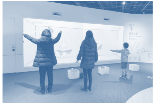
เล่นเกมให้ความรู้ด้านรังสี

ที่โซนนี้เป็นแหล่งความรู้ที่คนทุกวัยจะสามารถทำความเข้าใจกับรังสีได้ เพราะว่ารังสีเป็นสิ่งที่มองไม่เห็น ที่นี้จึงออกแบบวิธีการสื่อความรู้ให้ง่ายโดยใช้การ์ตูน คำอธิบายง่ายๆ เครื่องมือ และเทคโนโลยีต่างๆ เข้ามาช่วย