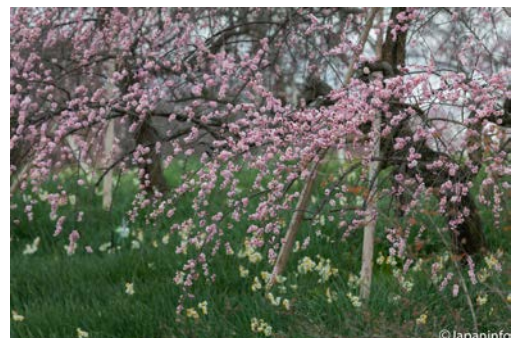
▲ ที่ไร่บ๊วยใน Izumi Recycle Park ชานกรุงโอะซากา

ตัวหนังสือจีนที่ใช้กำกับเจ้าแวง่นตาขาวนี้คือ 「繡眼児」 หมายถึงรอบตาสองข้างที่เรืองแสงด้วยขนสีขาว เหมือนน้กด้วยไหม ลำตัวของมันมีขนาดเพียงราวไม่เกิน 12 เซนติเมตร ยามกางปีกจะกว้างขึ้นเป็น 18 เซนติเมตร เล็กกว่านกกระจอก และยังเป็นนกขนาดเล็กอันดับที่สามของนกที่พบทั่วไปในญี่ปุ่นอีกด้วย ทว่าโดยนิสัยแล้วเจ้าแวง่นตาขาวนับเป็นนกกล้าหาญ มักพบเห็นว่ามันบินแย่งน้ำหวานจาก