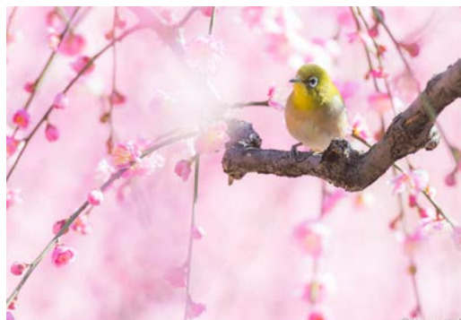
▲ เหมือนอีกโลกหนึ่งที่เต็มไปด้วยความสุข