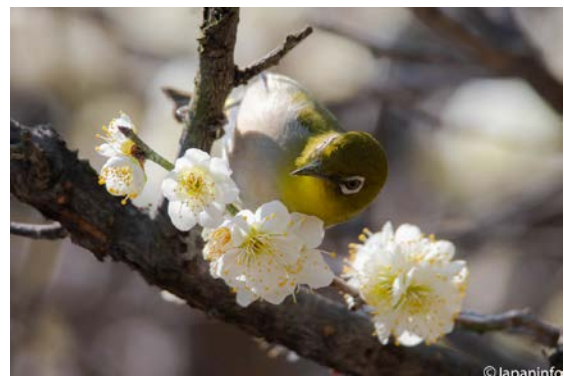
▲ รอบตาสีขาวดังมีคนมาปักใหม่ไว้