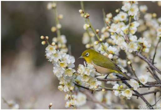
▲ ไต่ขึ้นมาด้านบนของต้นบ๊วย