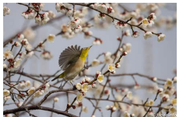
▲ ได้จังหวะตอนจะโฉบบิน