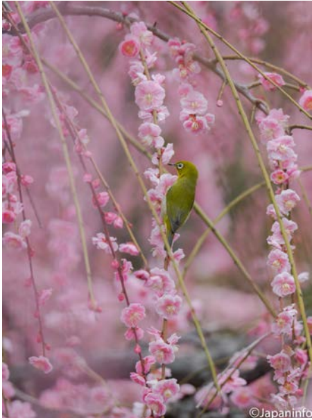
▲ กับบ๊วยพันธุ์ย่อย