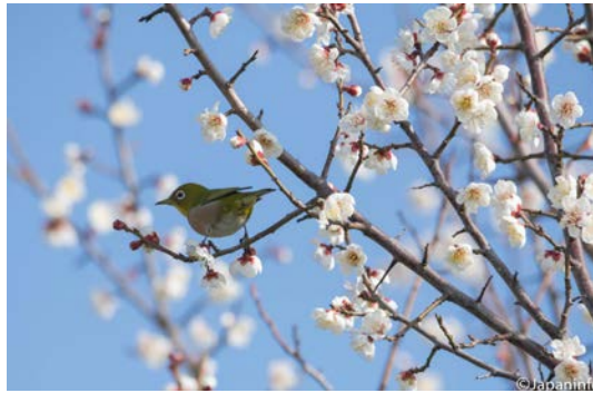
▲ หน้าตา และท่าทางของมันดูน่ารักน่าเอ็นดูไปหมด