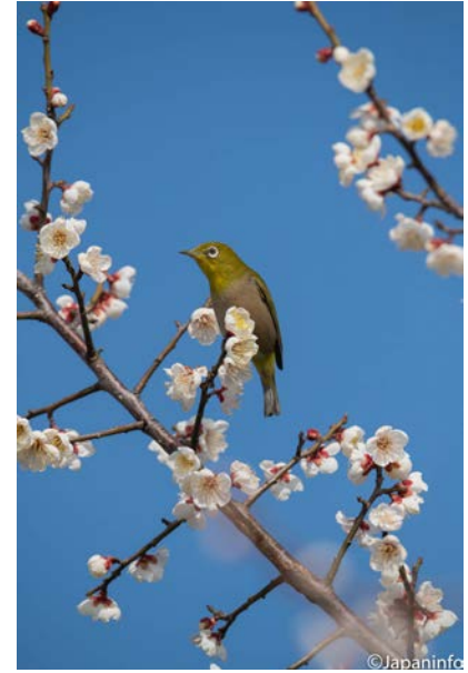
▲ ยามเมื่อท้องฟ้าสีครามสด จะยิ่งได้สัมผัสความงามของฤดูใบไม้ผลิ

ดอกไม้หรือผลไม้ แข่งกับนกปรอท (ฮิโยโดริ) ที่ตัวใหญ่กว่ามันกว่าเท่าตัวอย่างแฉ้วคล่องว่องไว