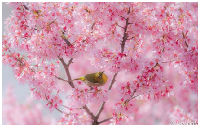
▲ แสงแดดอ่อนๆ กับซากุระสีสด เมื่อมีแว่นตาขาวมาเพิ่มเติมให้กลายเป็นภาพที่งดงามตรึงตา