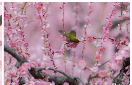
▲ ไม่กลัวคนเลย