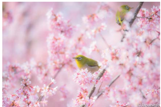
▲ พากันบินวนอยู่ทั้งวัน