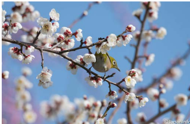
▲ ดูไม่ออกว่าตัวผู้หรือตัวเมีย