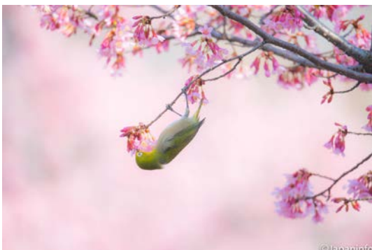
▲ ห้อยหัวดูคน้ำหวานจากซากุระ

ด้วยความที่แว่นตาขาวสามารถพบเห็นได้ทั่วไปนี่เอง ทำให้มันเป็นนกที่คนญี่ปุ่นคุ้นเคยมาแต่โบราณกาล หลังจากปี 2012 เป็นต้นมา กระทรวงสิ่งแวดล้อมได้ยกเลิกการ อนุญาตเลี้ยงนกแว่นตาขาวรวมทั้งนกอื่นๆ ไปแล้วทั้งหมด ปัจจุบันจึงไม่พบคน