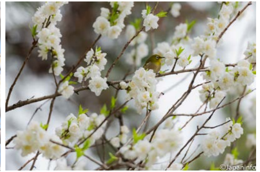
▲ พี่ชมหอมหวานก็เป็นของโปรดของแว่นตาขาว

เลี้ยงนกในกรงเช่นเมืองไทยเรา ดังนั้นหากต้องการเห็นหรือฟังเสียงร้องของพวกมัน ก็ต้องไปตามไร่บ๊วยหรือดงซากุระตามสวนสาธารณะ