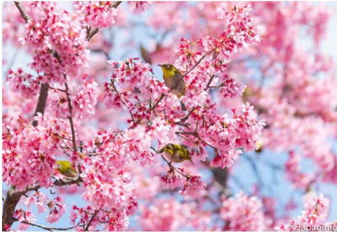
▲ ผุ้่งนกแวง่นตาขาวอพยพ ที่พบทุกปีเมื่อซากุระสายพันธ์ุโอะคาเมะบาน ที่สวน Tsurumi Ryokuchi Park