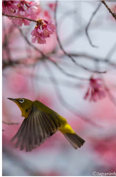
▲ โฉบบินจากกิ่งหนึ่งไปอีกกิ่งหนึ่ง