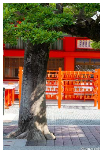
▲ แผงเรียงป้าย Ema ข้างศาลเอก