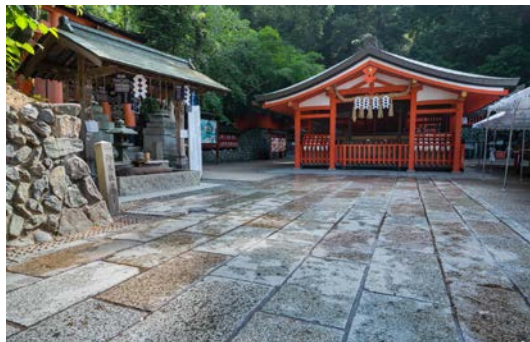
▲ เมื่อลอดูโมงคิไปจะพบกับศาล Okuno-in เล็กๆ

(ครองราชย์จาก ปี 661-721) ว่าให้สร้างศาล และ ถวายเครื่องบูชาจะได้ธัญญาหารสมบูรณ์