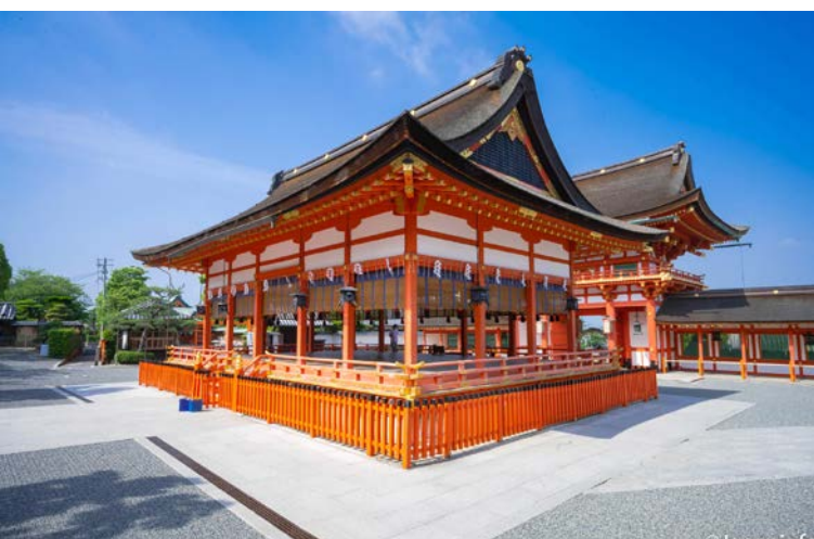
▲ ศาล Hai-den หลังประตู Romon

อินาริจินงะ หรือที่คนญี่ปุ่นมักเรียกกันว่า “โอะอินาริซัง” เป็นศาลชินโตที่บูชาเทพเจ้าแห่งข้าว และการเกษตร มีสัญลักษณ์สำคัญคือ เสือโทริอิสีขาว ที่เรียงรายซ้อนกันเป็นจำนวนหลายสิบ หลายร้อยต้น สองข้างตัวศาลเอก และตามจุดต่างๆ ยังมีสุนัขจิ้งจอกหรือ “คิทสุเนะ” ตั้งไว้ในฐานะสัตว์ประจำองค์ของเทพเจ้า ตัวศาลนั้น มีทั้งที่เป็นศาลเดี่ยวขนาดใหญ่ ศาลรองขนาดเล็กที่ตั้งในบริเวณศาลชินโตอื่นๆ หรือวัดพุทธ และศาลขนาดเท่าพระภูมิตามบ้านเรือนเกษตรกรหรือบางครั้งศาลในโรงงานหรือบนดาดฟ้าตึก เป็นต้น ว่ากันว่าทั่วประเทศมีศาลที่ใช้ชื่อว่า “อินาริ” ราวกว่า 30,000 แห่ง