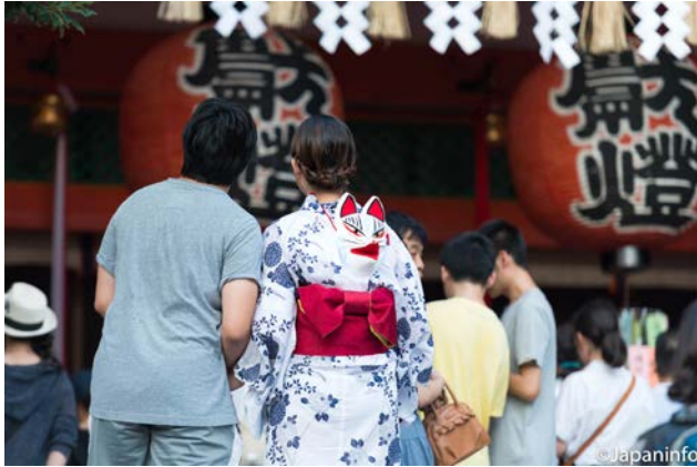
▲ นักท่องเที่ยวสวมชุดะแบบหน้าากาสุขั้งจอก มาเที่ยวชมเทศกาลประจำฤดูร้อน

ว่ากันว่าความเชื่อเรื่องลูกแก้ว (ทามะ) และกุญแจ (คางิ) นั้น เป็นที่รู้จักในหมู่นักสมัยเอโดะอย่างแพร่หลาย ช่างทำพลู พากันตั้งชื่อร้านโรงของตัวเองว่า “ทามะยะ” บ้าง “คางิยะ” บ้าง ทั้งนี้จากความเชื่อว่าเทพเจ้าอินาริยังศักดิ์สิทธิ์ช่วยป้องกันอัคคีภัยได้ด้วย ดูเหมือนว่า