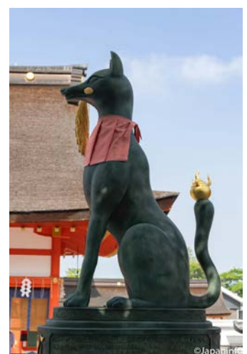
▲ สุนัขจิ้งจอกคาบรวงข้าว