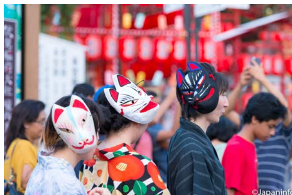
▲ หนุ่มสาวหาซื้อหน้ากากมาสวมเล่นจากร้านค้าใกล้ๆ

ศูนย์กลางของศาลอินาริทั้ง 30,000 แห่งทั่วประเทศนี้ อยู่ที่ตำบลฟุชิมิ ใน กรุงเกียวโตหรือที่นักท่องเที่ยวชาวไทย และชาวต่างชาติรู้จักกันดีในนามของ “ ฟุชิมิ- อินาริไทชะ ” คนเกียวโตที่ดั่งบ้านเรือนแถวนี้ เคยบอกว่าสมัยก่อนที่ไม่มีผู้คนพลุกพล่าน ขนาดนี้ เฟ็งจะมาหลายปีนี่เอง ที่นักท่องเที่ยวมาเยือนไม่ขาดสาย ขนาดได้รับเลือกให้ เป็นสถานที่ท่องเที่ยวอันดับหนึ่งติดต่อกัน 5 ปีซ้อน