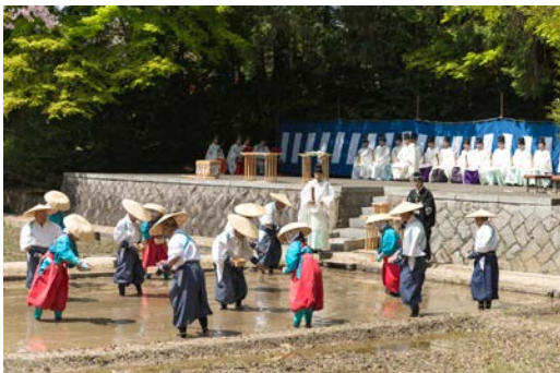
▲ เทศกาลหว่านเมล็ดข้าวทุกเดือนเมษายน