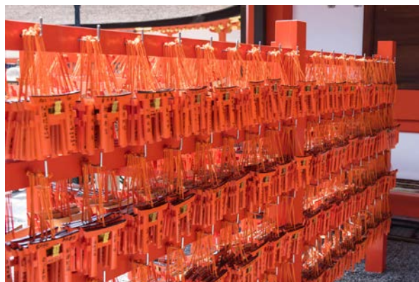
▲ E-ma เรียงรายเต็มแผง