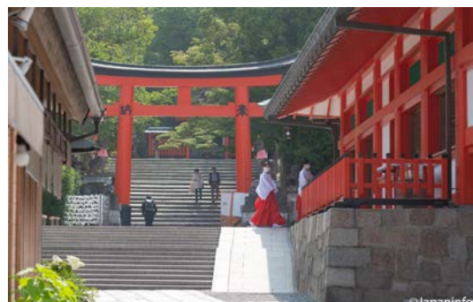
▲ เสาทริอิใหญ่ เสาทีสามจากทางเข้าศาล