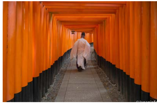
▲ ทางเข้าออก senbon Torii เดินเข้าจากทางขวามือ และออกจากทางซ้ายมือ