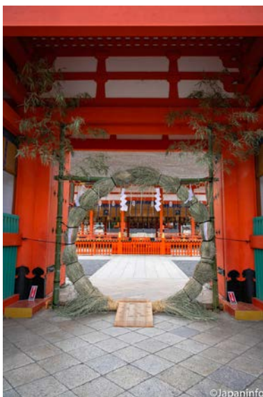
▲ ห่วงหญ้า O-harai ไว้ปิดเป่าสิ่งไม่ดีงาม ทุกวันที 30 มิถุนายน