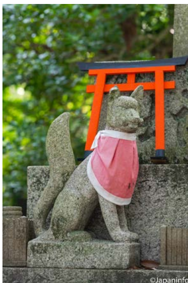
▲ สุนัขจิ้งจอกคาบลูกแก้ว