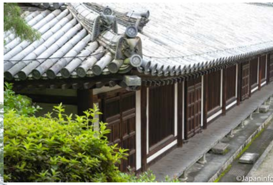
▲ วิหารไรโดมองจากด้านบน