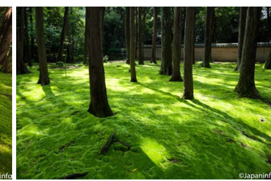
▲ ยามแสงอาทิตย์ลอดลงมาจากด้านบน จะเห็นมอสเป็นคลื่นงามจากความหนา