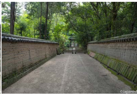
▲ ทางเดินเรียบสบงบนหน้าทางเข้าสู่สวนพระกันจิน