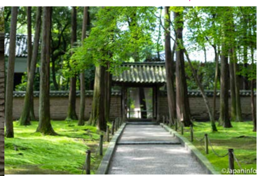
▲ มองย้อนไปที่ประตูทางเข้า

10 ปีผ่านไป นับตั้งแต่การพยายามเดินทางครั้งแรก พระกันจินได้มีอายุล่วงเข้า 66 พรรษา สูญเสียสายตาทั้งสองข้าง เมื่อมาถึงนาราพร้อมพระลูกศิษย์ 14 รูป ช่างก่อสร้าง ฯลฯ รวมทั้งสิ้น 20 นาย ในเดือนรุ่งขึ้น วัดโทไดจิ วัดหลวงในนารา ได้สร้างสถานที่อุปฐา (ไคดิง) ในโบสถ์ไดบุทสุเดง พระจักรพรรดิไซมุ ซึ่งทรงสละราชสมบัติแล้วพร้อมพระพันปีหลวง และจักรพรรดิโคเกงทรงเข้ารับศีลจากพระกันจิน ไม่นานนักก็มีการสร้างวิหาร ไคดิงอินแบบถาวรในบริเวณวัดโทไดจิ โดยอัญเชิญพระกันจิน ไปจำวัดที่กุฏิโทเซนอิน ทางทิศเหนือของวิหาร จากนั้นมารวมเวลา 5 ปีเต็ม ที่พระกันจินได้เป็นกำลังสำคัญในการบรรพชาพระสงฆ์ภายใต้กรรมวินัยที่เคร่งครัดที่วัดโทไดจิ วัดหลวงของญี่ปุ่น