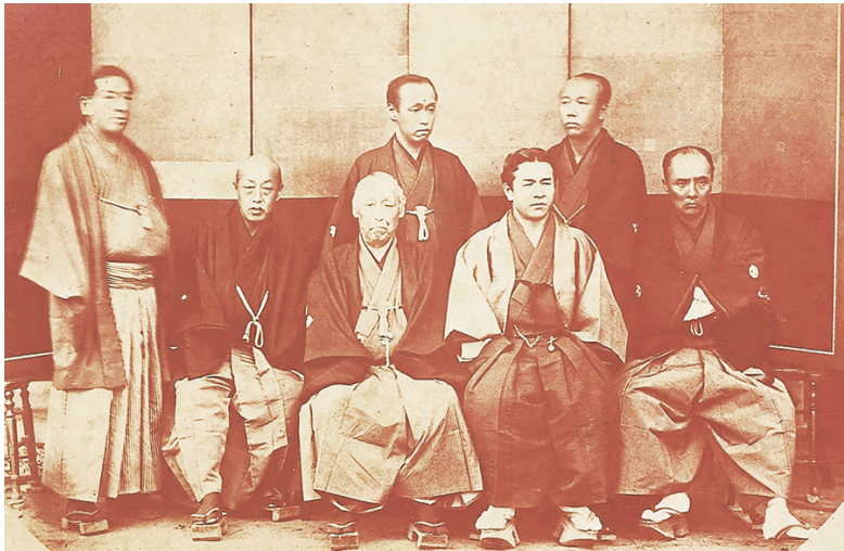
▲ Shibusawa Eiichi (แควหน้าคนที่สองจากขวามือ)

ชิบุซาว่า เออิชิ เกิดเมื่อปี 1840 ในตระกูลซาวานาที่ค่อนข้างมั่งคั่งในหมู่บ้านจิอาโรอิจิม่า (อำเภอฟุกะยะ จังหวัดไซตามะในปัจจุบัน) ครอบครัวเขาไม่ได้เป็นเจ้าของที่ดินรายใหญ่ เหมือนซาวานามั่งคั่งรายอื่น แคมที่ดินแถบนั้นยังใช้ปลูกข้าวเป็นส่วยส่งให้ชนชั้นนักรบผู้ปกครองเมืองไม่ได้ พ่อของเขาจึงต้องปลูกต้นคราม (อัย) นำมาตากแห้งปั้นเป็นครามแห้ง และออกซื้อขายครามทำรายได้แทน จากไหวพริบทางการค้า และความขยันหมั่นเพียร ทำให้พ่อ และตัวเขาที่ได้รับถ่ายทอดความรู้ด้านการค้าสามารถทำรายได้มากมาย และแม้ตำบลจิอาโรอิจิม่า จะทำนาผลิตข้าวไม่ได้ แต่ก็ตั้งอยู่ริมแม่น้ำ อยู่บนเส้นทางนากาเสนาโด ที่เชื่อมระหว่างเกียวโตกับเอโดะ เป็นศูนย์รวมของข้อมูลข่าวสาร เด็ก ๆ ที่นี่จึงได้ เรียนอ่านเขียนปรัชญาขงจื้อ อ่านหนังสือใหม่ ๆ จากตะวันตก ติดตามความเปลี่ยนแปลง ของประเทศที่กำลังสั่นคลอนจากอิทธิพลของอารยธรรมตะวันตกอย่างใกล้ชิด