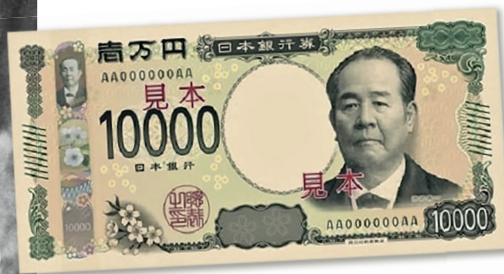
▲ ตัวอย่างธนบัตรราคา 10,000 เยนที่ใช้ Shibusawa Eiichi เป็นสัญลักษณ์ จะเริ่มใช้จากปี 2024