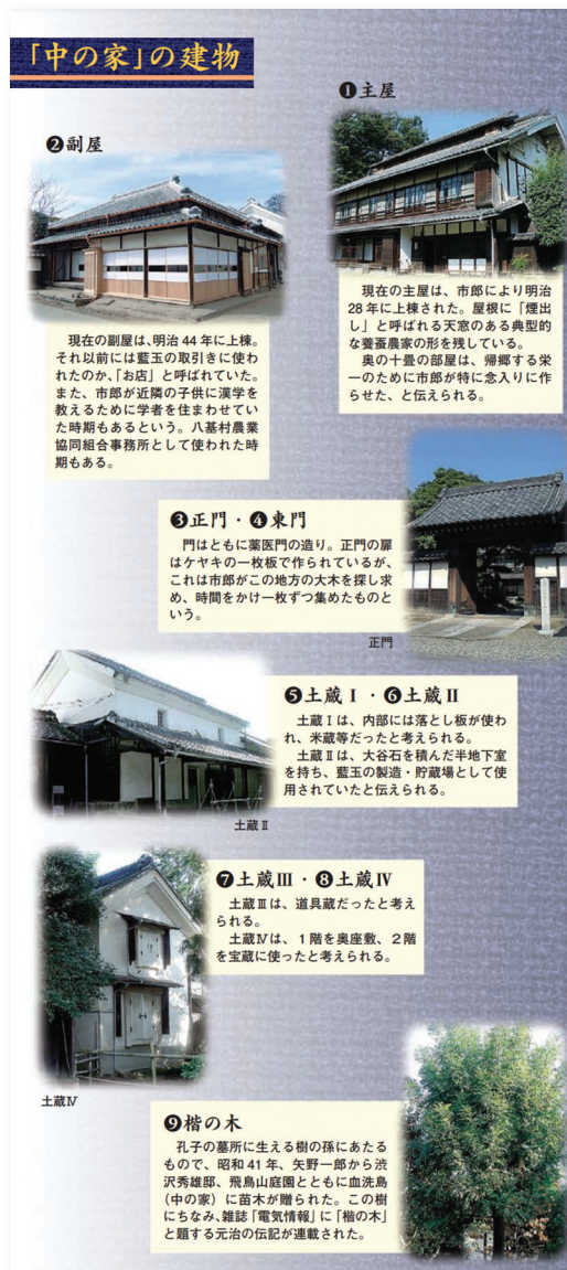
▲ บ้านเกิดของ Shibusawa ที่จังหวัด Saitama