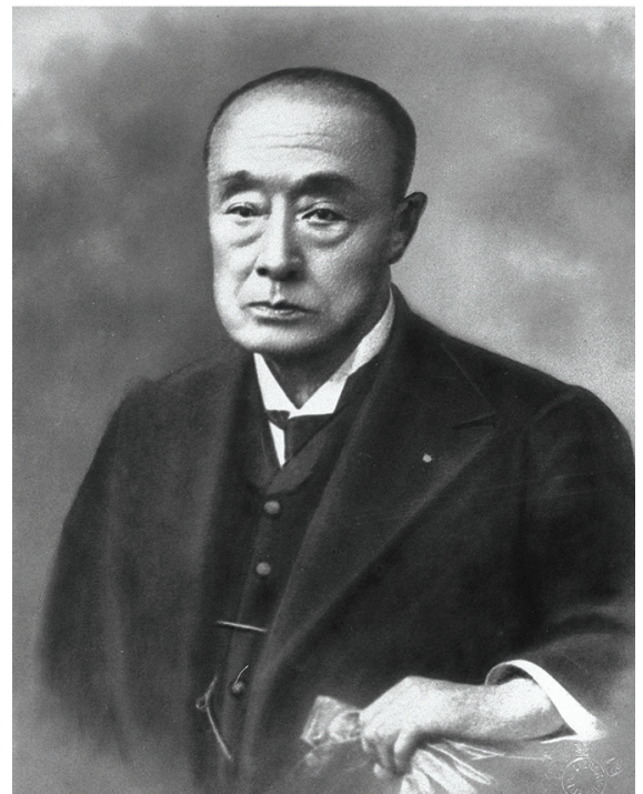
▲ Tozukawa Yoshinobu โชกุนคนสุดท้ายของตระกูล Tokugawa

ชิบุซาว่า เข้าไปดูแลการเงินให้ โยชิโนบุ จนแข็งแรงแรงภายในเวลาไม่กี่ปี โยชิโนบุ ซึ่งก้าวขึ้นมาเป็นโชกุนคนที่ 15 ของตระกูลโทกุกาว่า จึงเลือกให้เขาช่วยไปในคณะทูตคุมการเงินของคณะไปเยือนฝรั่งเศส และยุโรปในปี 1867 ชิบุซาว่าได้สัมผัสความเจริญ และเทคโนโลยีใหม่ ๆ ในมหกรรมแสดงสินค้าที่ปารีส และได้เรียนรู้การระดมทุนจากเอกชน มาดำเนินกิจการรถไฟ การ